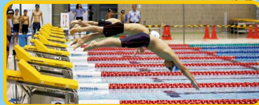
▲スタート台から一斉に飛び込む