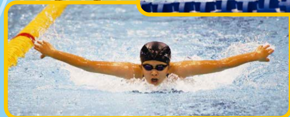
▲手を翼のようにして泳ぐバタフライ