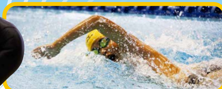
▲最もスピードの出るクロール