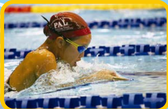
▼ガイガイと力強く進む平泳ぎ