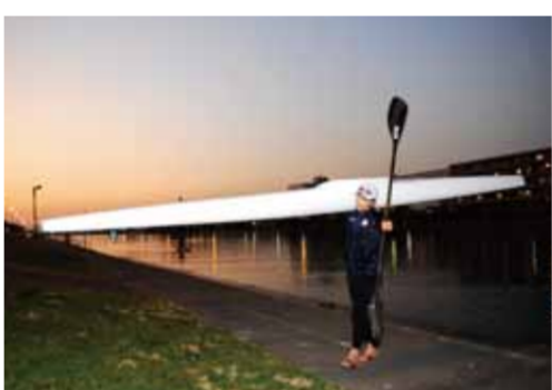
カヌーはスピードを出すために、軽量化されているから、一人でも持てる!