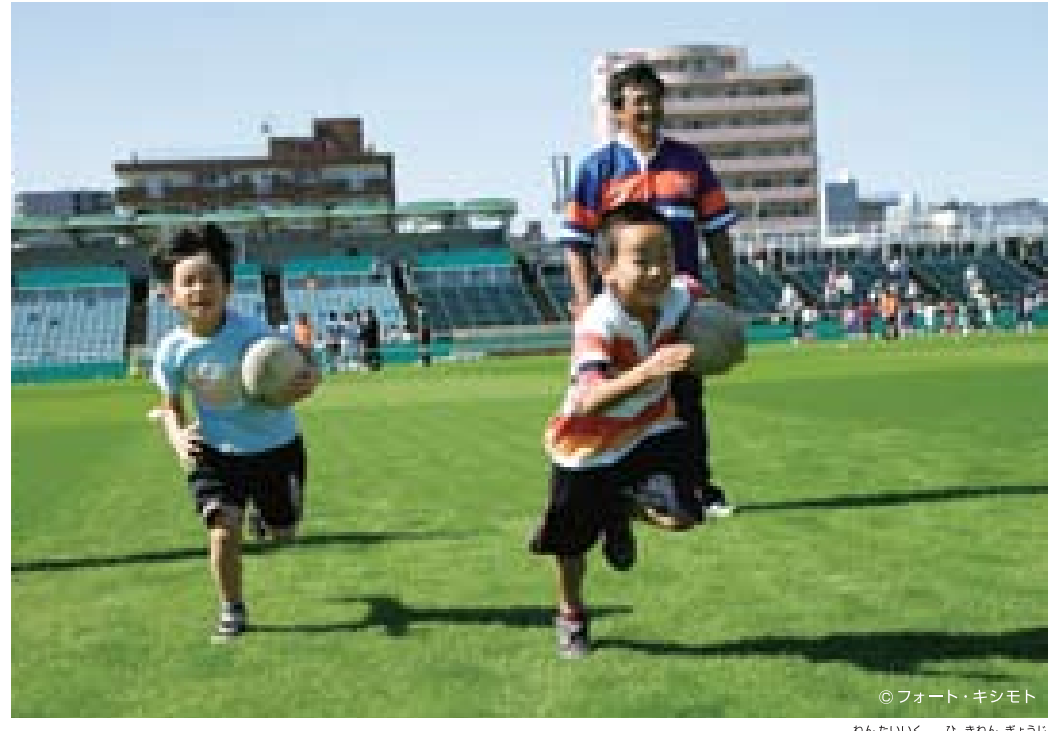
2006年 体育の日記念行事