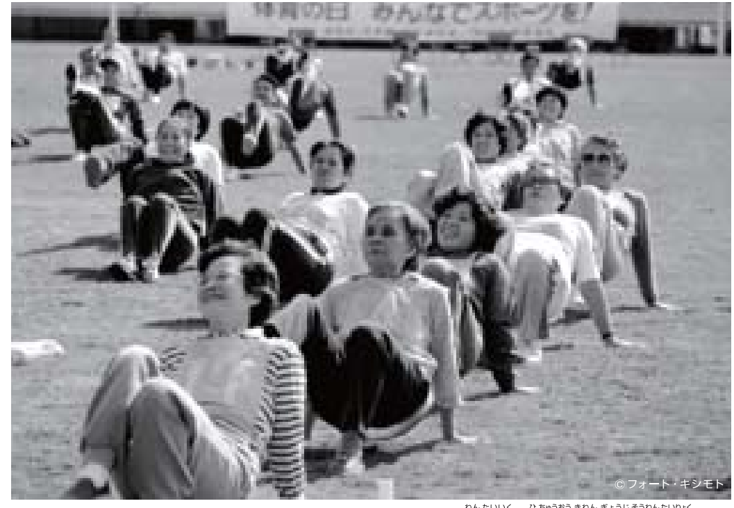
1982年 体育の日中央記念行事 社体年体カテスト

日本体育協会は、スポーツを普及させるために1911年に設立され、今年で100年を迎えました。スポーツは、人類共通のすばらしい文化のひとつです。“からだ”を強くして健康を増進するだけでなく、爽快感や達成感、連帯感といった“こころ”も充実させてくれます。そして、これからの世の中には、スポーツの持つ力が、もっとも重要になってくると考えられています。日本体育協会は、年齢や体力、目的に応じて、誰もが、いつでも、どこでもスポーツに親しめる「生涯スポーツ」を広めていきます。