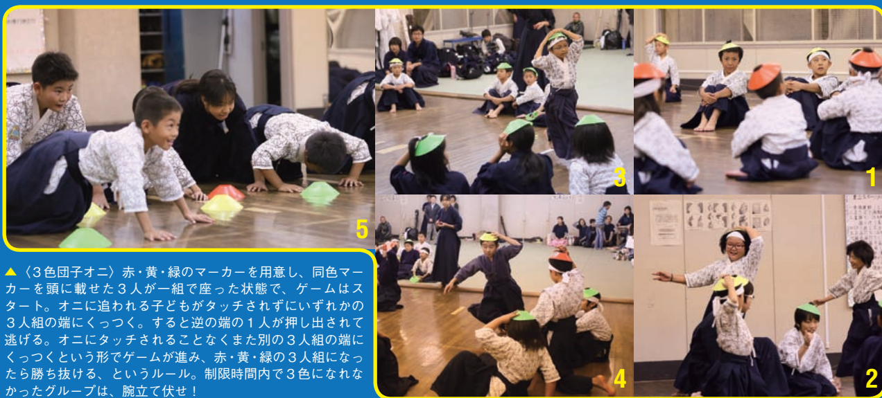
▲〈3色団子オニ〉赤・黄・緑のマーカーを用意し、同色マーカーを頭に載せた3人が一組で座った状態で、ゲームはスタート。オニに追われる子どもがタッチされずにいずれかの3人組の端にくっつく。すると逆の端の1人が押し出されて逃げる。オニにタッチされることなくまた別の3人組の端にくっつくという形でゲームが進み、赤・黄・緑の3人組になったら勝ち抜ける、というルール。制限時間内で3色になれなかったグループは、腕立て伏せ！

「11月最終週からは防具を着けるんです」と、松井満男団長が凛々しくなった新入団員たちを見やる。道着もすっきり肌になじみ、熱気でむせ返る夏の道場での稽古も乗り越えた少女剣士たちの裸足に、床の冷たさがしみ始めた秋。春から導入したアクティブ・チャイルド・プログラム（ACP）も、実りの時期を迎えていた。