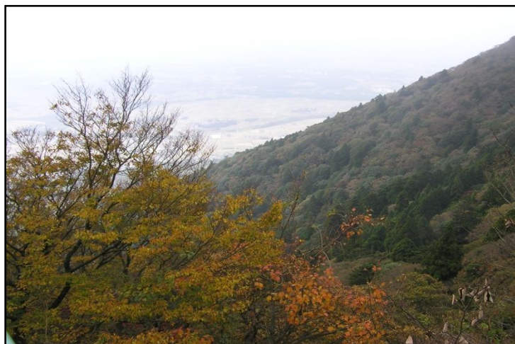
秋の彩りに染まる七会の山なみ