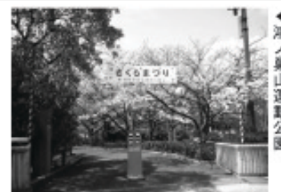
鴻ノ巣山運動公園

▼日程 4月3日(日) JR城陽駅東口 午前9時30分受付開始(受付順に出発)・JR長池駅 午後2時30分頃解散※雨天中止 ▼コース JR城陽駅→久世神社→正道官衙遺跡→水度神社→鴻ノ