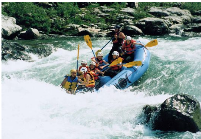
吉野川のラフティング

急速に進む過疎化、少子・高齢化や町村合併後の市民の一体感の希薄化が原因となり、健康づくりのための活動や地域スポーツ環境の衰退が危ぶまれましたが、危機をチャンスととらえてまちを愛する人々の心を大切に、組織や仕組みを見直し元気を取り戻そうとクラブを立ち上げ活動しています。