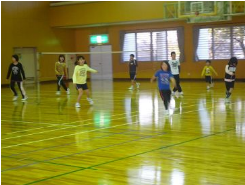
レクリエーションキッズ教室