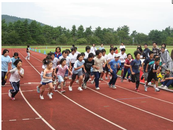
秋のスポーツ体カテスト

なお、毎月の活動予定は町内の公共施設等に置かせていただいている「クラブだより」により、誰もが知ることができ会員以外の方でも興味のあるプログラムがあれば、その都度200円の参加料を支払うことで活動に参加できる仕組みとなっています。