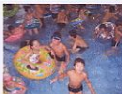
↑けんじワールドにて↓