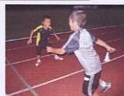
↑チャレンジSAQ ↓常勤先生プログラム