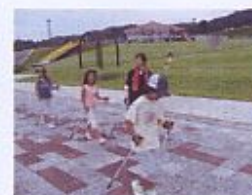
↑ノルディックウォーキング