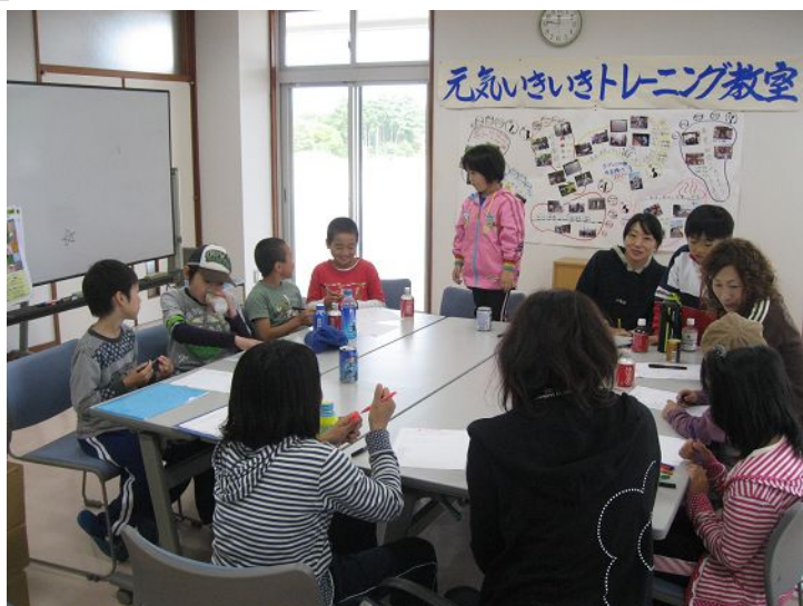
クラブミーティング

「みんなのクラブはみんなでつくろう」をテーマに毎月1回クラブミーティングを開催しています。このクラブミーティングには会員の誰もが「フラット・フリー・オープン」な形で参加することができ、そこで出された意見や要望などをクラブの活動に反映させています。