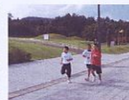
↑ランニング合同練習会!