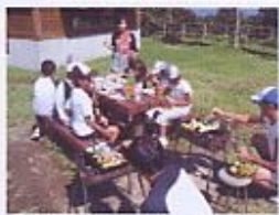
↑いわて子どもの森にて↓