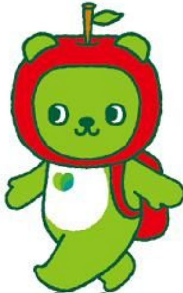
長野県PRキャラクター「アルクマ」