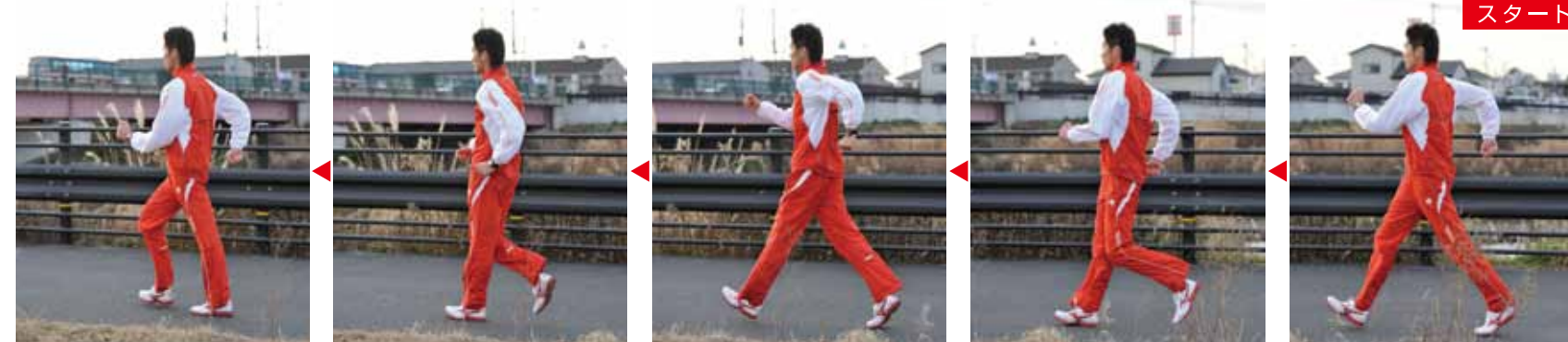
森岡選手は50km競歩に出場。マラソン(42.195km)よりも長い距離を歩き歩きます。競歩は歩くフォームが大切。両足が地面から離れてしまうと違反になります。