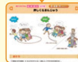
▲2種類のガイドブックに掲載している運動遊びと伝承遊びを紹介。遊び方なども動画にまとめています。