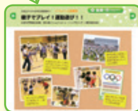
▲アクティブ・チャイルド・プログラムを取り入れた全国各地の実践事例を紹介。動画も視聴できます。