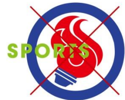
他の要素を加えない