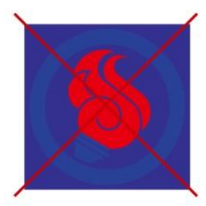
可視性の低い背景色を使わない