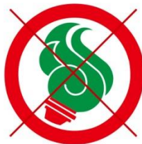
指定色以外を使わない