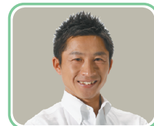
荻原 健司 氏