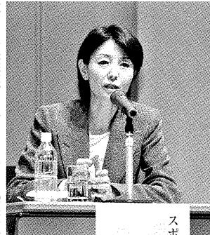
三屋 裕子氏(みつや ゆうこ) 1958年福井県生まれ。中学からバレーを始め、84年にパリオリンピックで銅メダルを獲得。現在は筑波スポーツ科学研究所副所長に就任し、バレーボール指導のほか幅広く活躍中。

地域において子どもから高齢者までさまざまなスポーツを愛する人たちが参加できる「総合型地域スポーツクラブ」が、県内に現在三十一カ所あります。そこで繰り広げられるスポーツの楽しさや可能性についての育成推進フォーラムがこの十一月二十三日に朱鷺メッセにて開催されました。