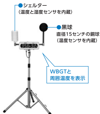
図2 WBGT測定装置 (リアルタイムでWBGTと周囲温度が表示される)