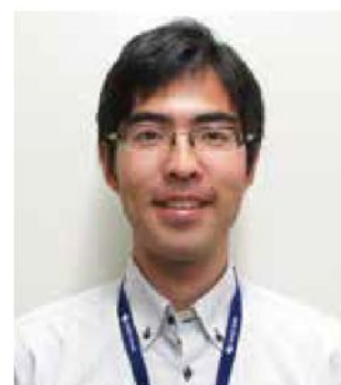
運営ボランティア 株式会社福井銀行 ブランド戦略チーム

天皇杯、皇后杯を受賞し最高の形で終えた「福井しあわせ元気 国体・障スポ」。私の人生で最後になるであろう地元開催の福井国体を目いっぱい楽しませていただきました。