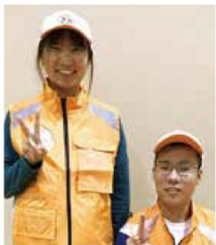
親子ボランティア 福井県立福井特別支援学校

国体・障スポに深く関わって、忙しくも楽しい半年でした。この経験を活かして、これからも福井の発展のためにお力添えできればと思います。