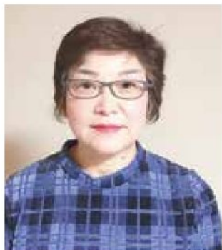
運営ボランティア