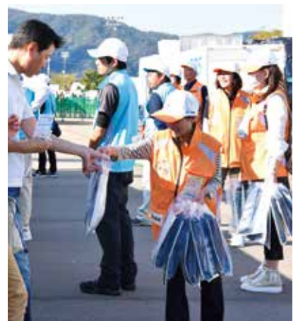
炬火文化プログラム