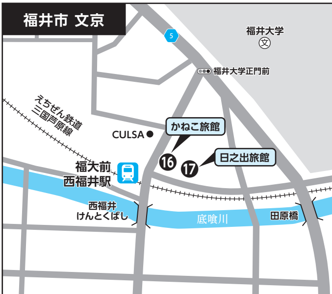
⑯ かねこ旅館 ⑰ 日之出旅館