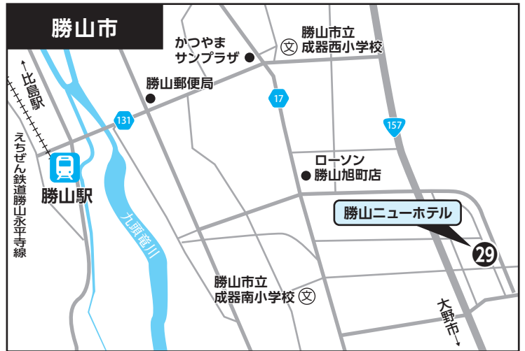
②⑨ 勝山ニューホテル