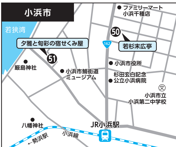
⑤⑩ 若杉末広亭 ⑤⑪ 夕雅と旬彩の宿せくみ屋