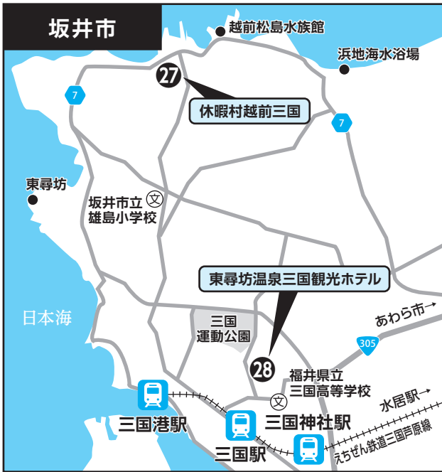
②⑦ 休暇村越前三国 ②⑧ 東尋坊温泉三国観光ホテル