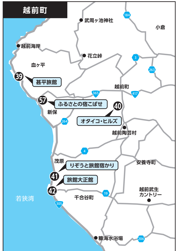
③⑨ 甚平旅館 ④① りぞうと旅館宿かり ⑤⑦ ふるさとの宿こばせ ④④ オタイコ・ヒルズ ④② 旅館大正館