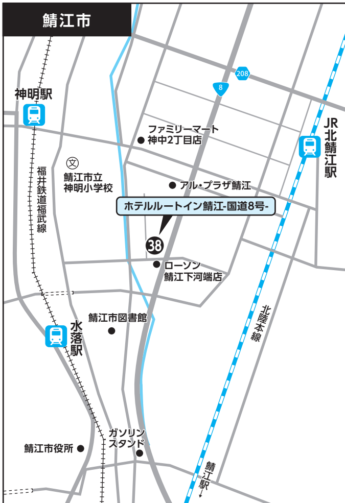
③⑧ ホテルルートイン鯖江-国道8号-