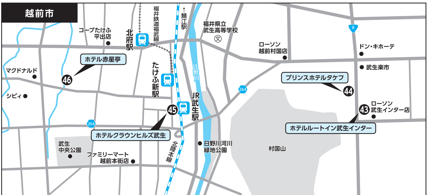
④③ ホテルルートイン武生インター ④④ プリンズホテルタケフ ④⑤ ホテルクラウンヒルズ武生 ④⑥ ホテル赤星亭