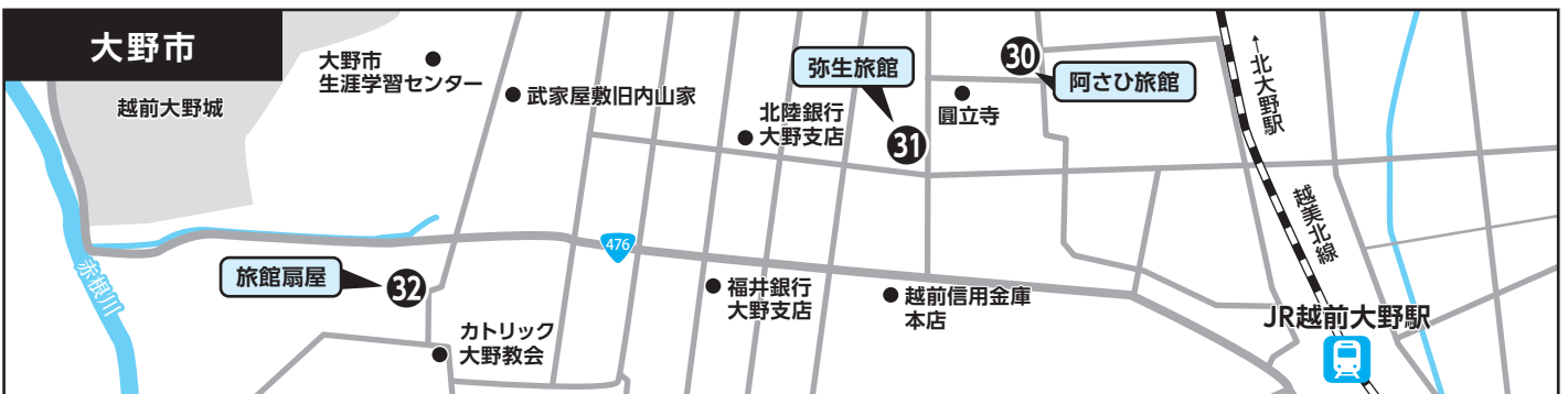
③⑩ 阿さひ旅館 ③⑪ 弥生旅館 ③⑫ 旅館扇屋