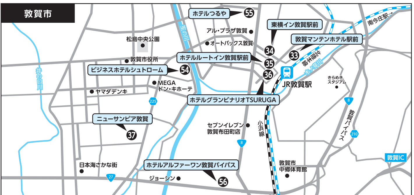
③③ 敦賀マンテンホテル駅前 ③④ 東横イン敦賀駅前 ③⑤ ホテルルートイン敦賀駅前 ③⑥ ホテルグランビナリオTSURUGA ③⑦ ニューサンピア敦賀 ③④ ビジネスホテルシュトローム ③⑤ ホテルつるや ③⑥ ホテルアルファワン敦賀バイパス