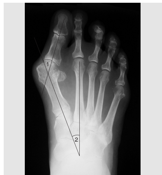
図 III-D-141 外反母趾例のX線像

母趾内転筋，長母趾伸筋，長母趾屈筋，母趾外転筋が母趾の外反変形に作用する。外側種子骨の脱臼も認める。（文献7）より）