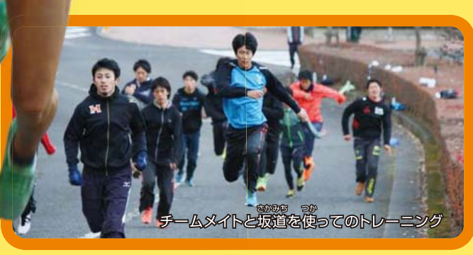
チームメイトと坂道を使ってのトレーニング