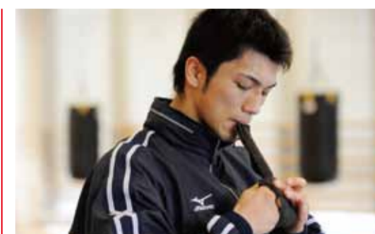
インタビューでは穏やかな表情だったが、グローブをつけると鋭い顔つきに。