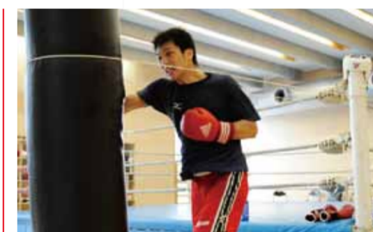
練習メニューは自分で考える。どれだけ自分に厳しくなるか。