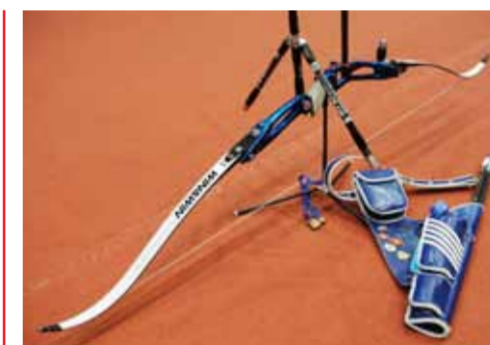
弓にはいろんな装備が付いていて、自分に合った調節がしてあるんだ。