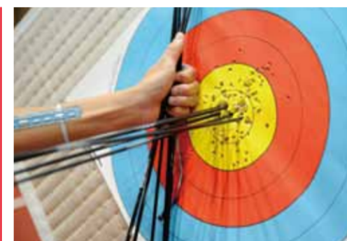
練習で30mの距離から放った矢は、ほとんど中心に。さすが!!