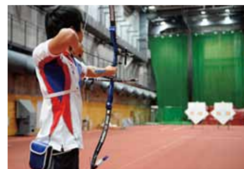
30mの距離での練習シーン。弓を引く筋力と強い精神力が大切なんだ。