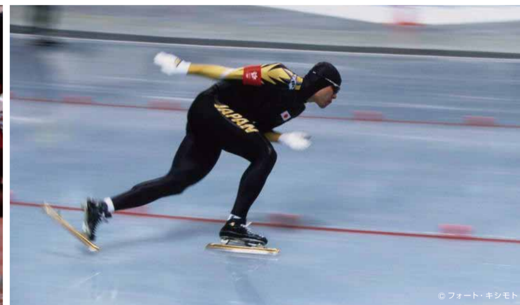
1998年長野オリンピック/男子スピードスケート