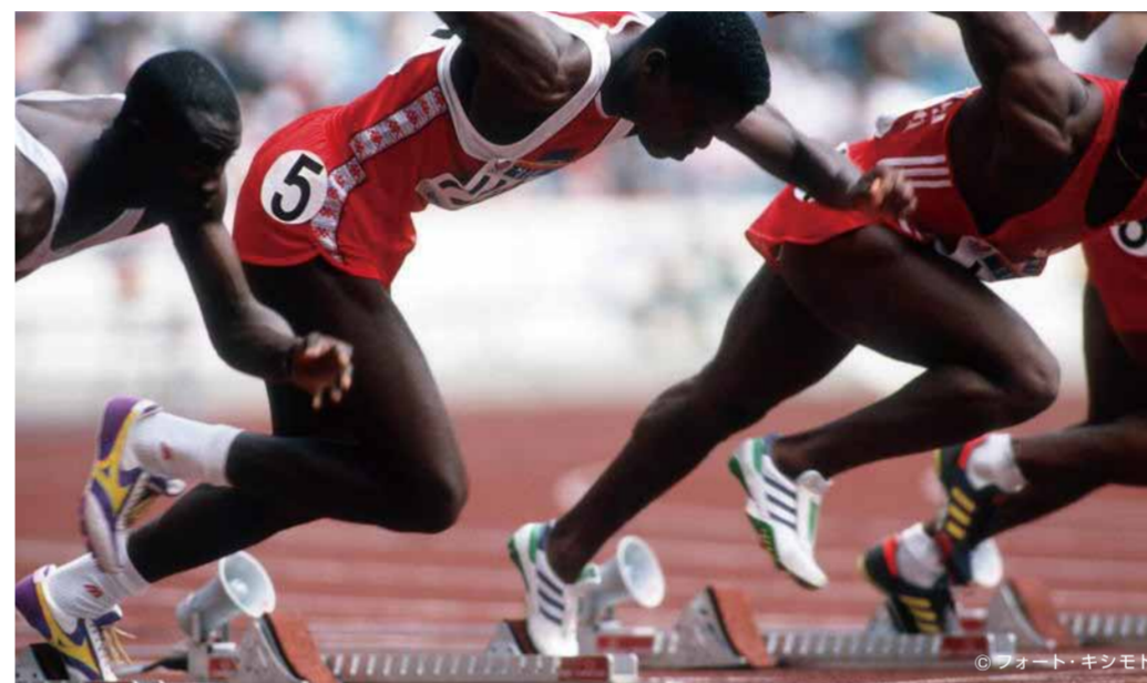
1988年ソウルオリンピック/男子100m走

陸上100m走の世界記録はウサイン・ボルト選手(ジャマイカ)の9.58秒。100年で約1秒短縮されました。この間に、走るコースは土から全天候型に変わり、靴も大きく進化しました。1940年頃には片足200グラムありましたが、1988年ソウルオリンピックで優勝したカール・ルイス選手(アメリカ)の靴は、115グラムという軽さでした。また、長野オリンピックではスラップスケートという、かかとから刃が離れる靴が登場。驚異的な記録ラッシュを引き起こしました。スポーツの進化には選手の努力とともに、用具も大きく貢献しているのです。