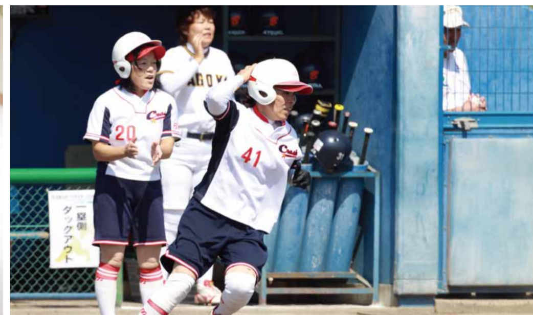
写真は過去の大会のもので