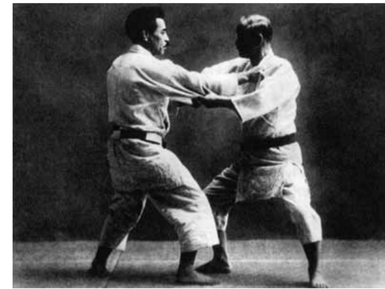
三船久蔵十段(左)と稽古する嘉納先生