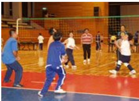
「遊ゆうクラブ」は、幼児から高齢者まで全員で楽しく活動しているクラブです。

茨城県坂東市は、平成17年に岩井市と猿島町が合併して誕生した水と緑につつまれた自然豊かな田園都市です。平成14年に旧岩井市に「遊ゆうクラブ」が、平成18年度に「スポーツクラブさしま」が誕生しました。いずれも市町合併の思惑に地域スポーツの環境は忘れられていましたが、総合型地域スポーツクラブとしての活動内容とは違い、目指すところが同じならば「共有する課題には協働で取り組もう」との認識で「坂東市スポーツクラブ協議会」を結成し、関係を深めることになりました。