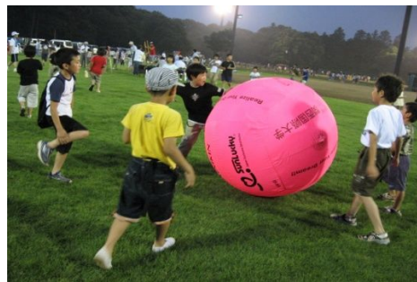
「住んで良かった...ネ」そんな街を「スポーツクラブさしま」は、いつも考えています。