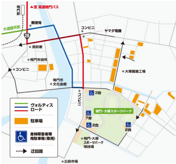
[鳴門・大塚スポーツパーク公園案内図]

〒772-0017 鳴門市撫養町立岩字四枚 61 番地 TEL : 088-685-3131