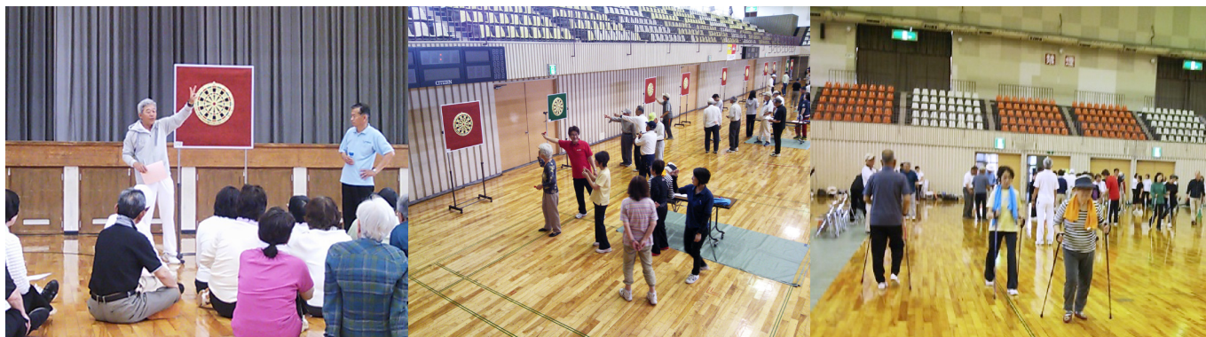
ニュースポーツ世代間交流会 in 久留米 ～笑顔と笑いのスポーツ大会～