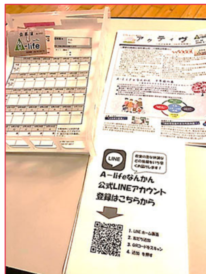
会員登録時は、年に一度、皆さんのお声を直に伺える機会です。左上は会員証と健康チェック表。