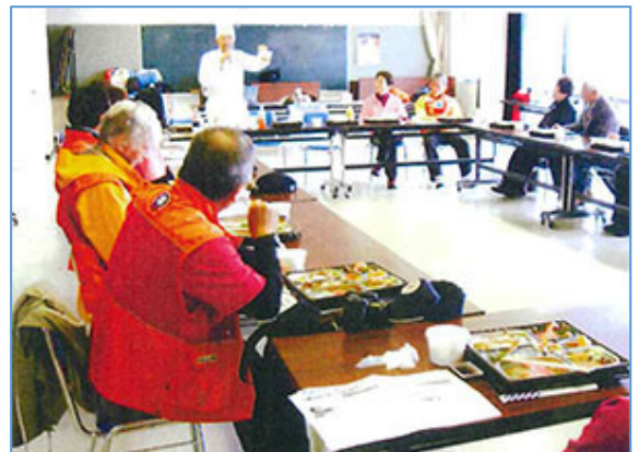
アスリート弁当で交流会状況