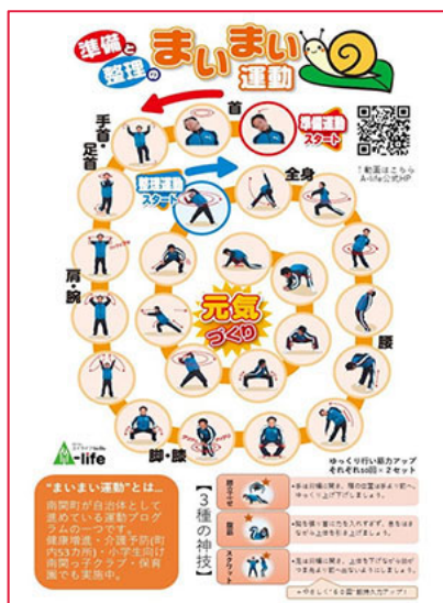
コロナウイルス対策チラシ(運動紹介面)。右上のQRコードから動画の視聴できる。裏面は感染症対策情報を掲載。

連絡先 〒861-0803 熊本県玉名郡南関町大字関町1283番地 TEL 0968-57-9616 FAX 0968-57-9617 URL http://a-life-npo.com E-Mail info@a-life-npo.com