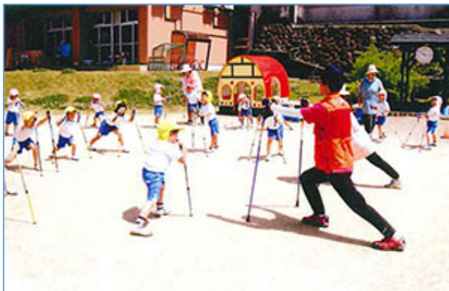
上野子ども園NW教室ボールストレッチ