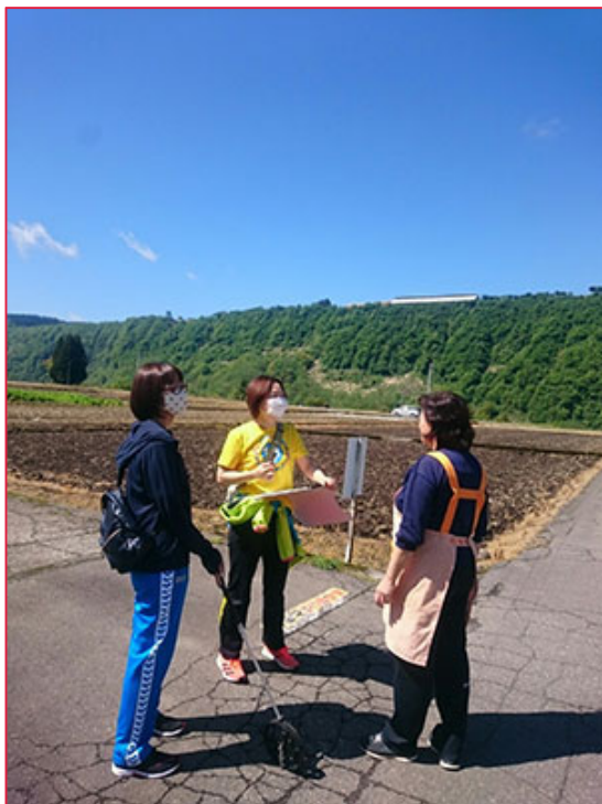
住民といっしょに集落単位でウォーキングコースの新設を目指している。今できることを実践する毎日である。

連絡先 〒949-8201 新潟県中魚沼郡津南町大字下船渡丁1633番地1 TEL 025-765-5776 FAX 025-765-3596 URL https://www.facebook.com/npotap5776/ (Facebook) E-Mail tap@poplar.ocn.ne.jp