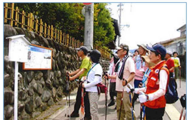
勝山市ジオパーク事業(七里壁)：NWで高札巡り