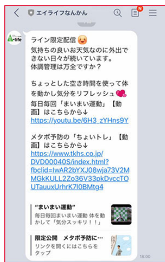
配信したLINEメッセージ 堅苦しくならないように注意。