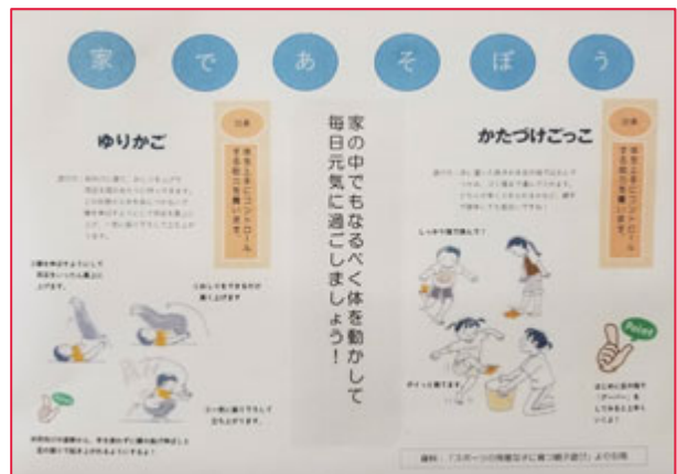
学校を通じて小学生向けに自宅でできるあそびを提案。(「スポーツの得意な子に育つ親子遊び」より引用)