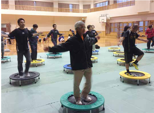
総合型クラブ交流会において「ミニトランポリン」を体験する様子