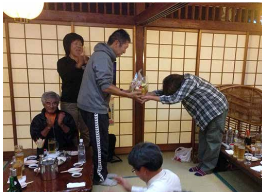
総合型クラブ交流会の懇親会の様子