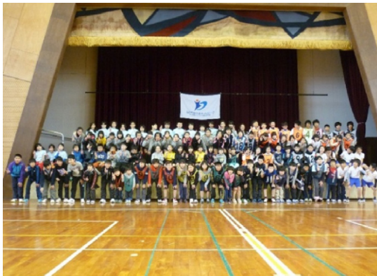
[第2ブロック] ドッジボール交流大会 集合写真