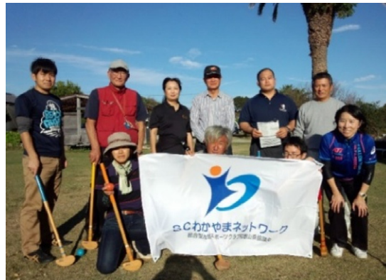
[第4ブロック] クラブ交流研修会 1日目グラウンド・ゴルフ研修会参加者集合写真